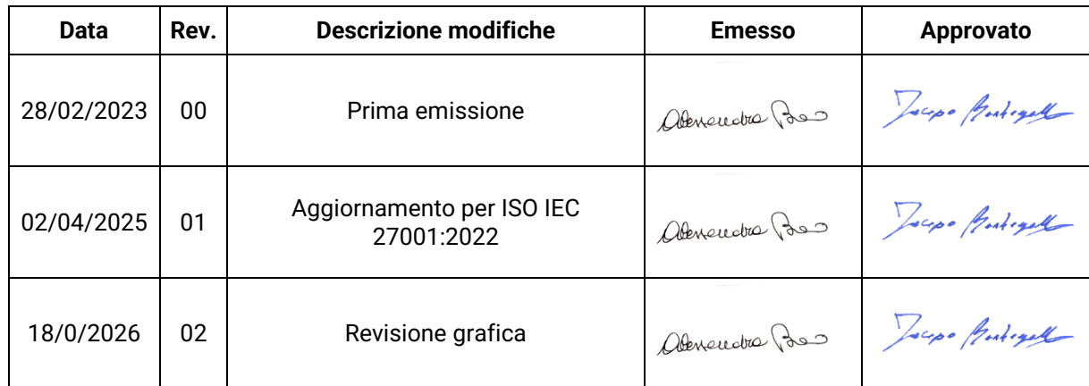
Tabella delle modifiche